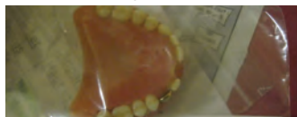
La collecte des prothèses a lieu dans des sachets individuels après le dîner

Grâce à un financement partiel de l'Agence Régionale de Santé et sur demande du Centre Hospitalier (site de Lons), une opération de nettoyage et d'analyse des prothèses a été menée courant mars 2016 pour les résidents et patients volontaires.