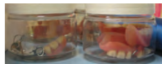
Les prothèses sont rendues dans une boîte nominative le lendemain matin et elles brillent !