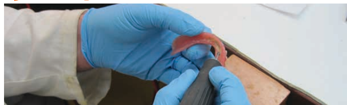
La plaque de tartre est bien visible sur cette prothèse en cours de traitement durant la nuit

Oui, prendre soin des personnes confiées à l'Ehpad ou en USLD va jusqu'aux dents. Même si la cavité buccale n'est que rarement suspectée de nécessiter des soins, et parfois peu surveillée, une expérience récente à Chaudon et Vallière a mis au jour l'importance des prothèses dentaires, dans la qualité de la vie des résidents ou patients.